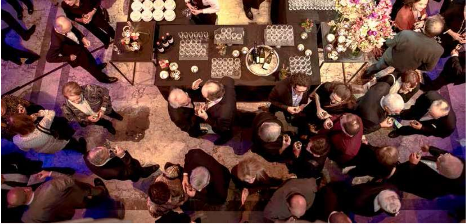
Cocktail dinatoire à la Villa Empain pour célébrer les 175 ans de l'UAE-7 décembre 2018